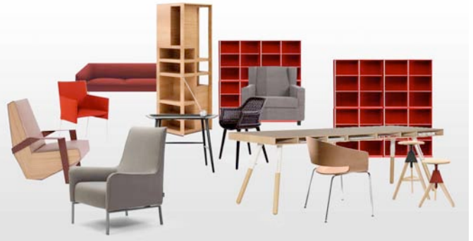
Ausblick auf die „Readers’ Lounge“, die Premiere zur imm cologne hat