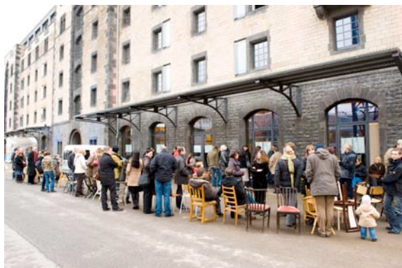
Großer Andrang 2009 zur ersten „CHAIRity“ Aktion im Rheinauhafen

Ahrend | Andreu World | Arco | Arper | Flötotto | Fritz Hansen | Kartell | Magis | Montis | Moroso | Thonet | Vitra