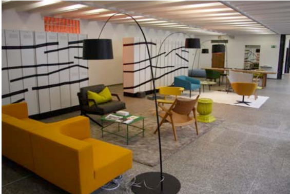
Die erste Design Lounge im MAKK eröffnete im Oktober 2011