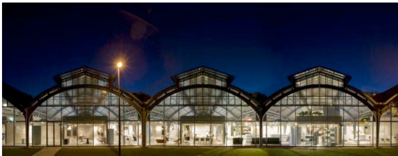
Januaratmosphäre zur imm cologne – die Dreigelenkbogenhallen der Design Post

Großzügige Glasflächen schenken der Design Post Tageslicht und den Exponaten eine authentische Lichtquelle, um das mögliche Einpassen in ein Lebensumfeld zu simulieren. Die raue Anmutung des Betonbodens wird durch eingezogene Holztreppe und -elemente durchbrochen, die Anordnung von offenen und geschlossenen Ausstellungsflächen macht einen Besuch abwechslungsreich und inspirierend.